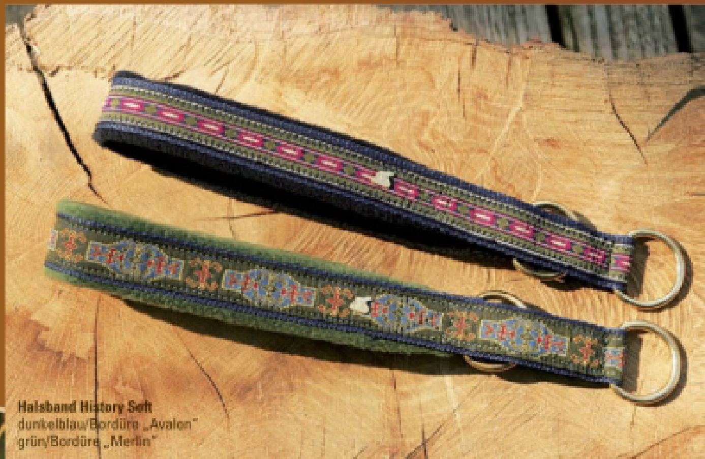
Halsband History Soft dunkelblau/Bordüre „Avalon“ grün/Bordüre „Merlin“