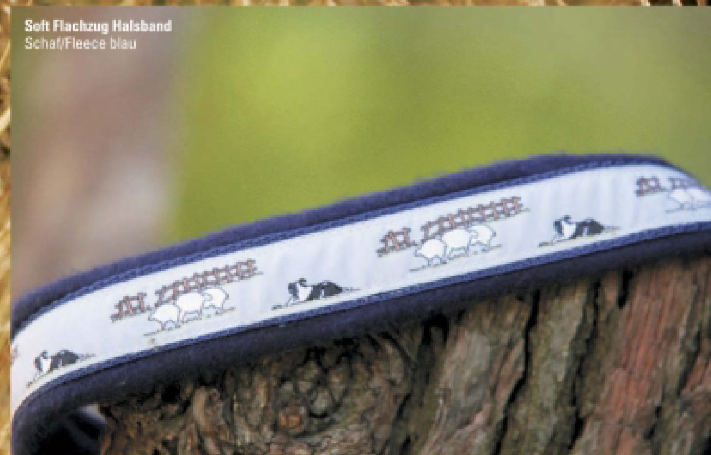
Soft Flachzug Halsband Schaf/Fleece blau